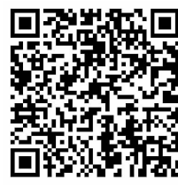
更多图片视频 扫码观看

溪河解冻,绿芽抽条。3月12日,我国第46个植树节如期而至,化肥分公司、科技公司、复合肥一体化、高分子子公司、双瑞公司以及公共事务管理中心等单位、直属机构分别开展植树活动,党员、团员、志愿者化身“园丁”,用心用情植绿、护绿、爱绿、兴绿,播撒绿色种子,收获生机盎然,建设美丽厂区和生活区。当天,技术经济研究院农技人员参加西南局植树活动,现场提供种植技术服务,共同助力生态文明建设。